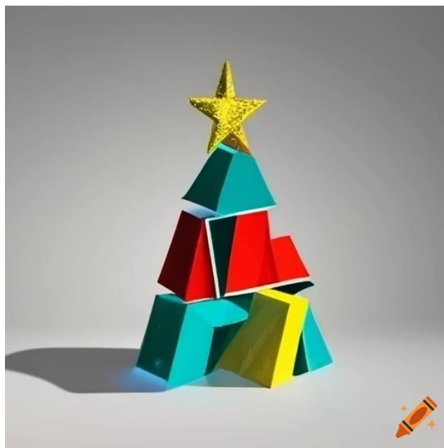
Obr. 4 Obrázek vygenerovaný Craiyon

Obrázek citujeme podobně jako text, v tomto případě tedy takto: